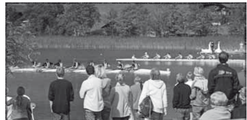
Vor dem Schlechtwetter-Abbruch: Zieleinlauf-Atmosphäre am Schwarzsee.

Trophy insgesamt CHF 3'800.- an Preisgeldern zur Verfügung. Die Regatta, die dann am 8. und 9. September stattfindet, sollten bereits jetzt die ambitionierten Doppelzweier in ihrem Terminkalender notieren. Der Freiburger Regattaverein freut sich, auch im September 2012 wieder viele junge Sportler auf dem Schwarzsee begrüßen zu dürfen. Auch dann werden wieder die Mix-Rennen oder das Race Eltern & Kid den Samstag prägen; wo sonst kann man einmal mit der Kollegin zusammen ein Rennen bestreiten. Jens Lischewski