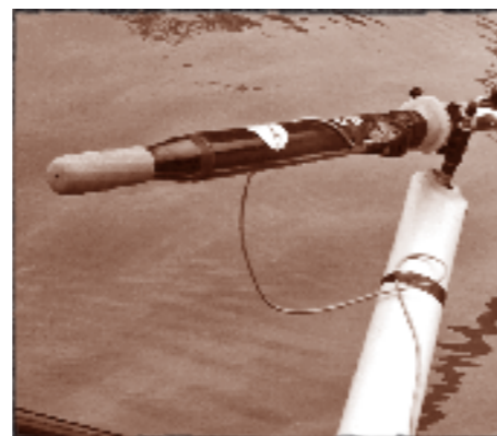
Sensoren am Skulls montiert

In der zweiten Messung haben wir zwei Trainings auf Rennfrequenz gemacht in zwei verschiedenen Booten. Dabei haben wir mittels der Bootssensoren insbesondere die Beschleunigung und Stabilität bei verschiedenen Schlagzahlen untersucht und zwischen den beiden Booten verglichen. Noch dauert die Auswertung der Sensoren länger als der Entscheid von Athleten und Trainer für das von der Firma Empacher uns zur Verfügung gestellte Boot. Doch das Ergebnis war erstaunlich eindeutig: Das Boot, das die Mannschaft schliesslich fuhr, war auf Renn-tempo stabiler und bewegte sich gleichmässiger, was im Nachhinein unsere Entscheidung unterstützte.